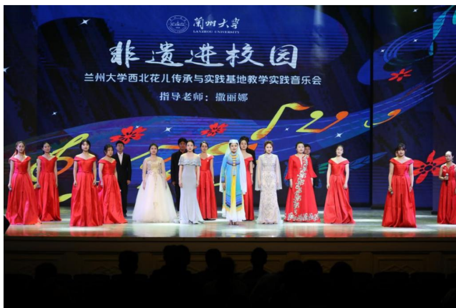
图二“花儿”艺术实践音乐会