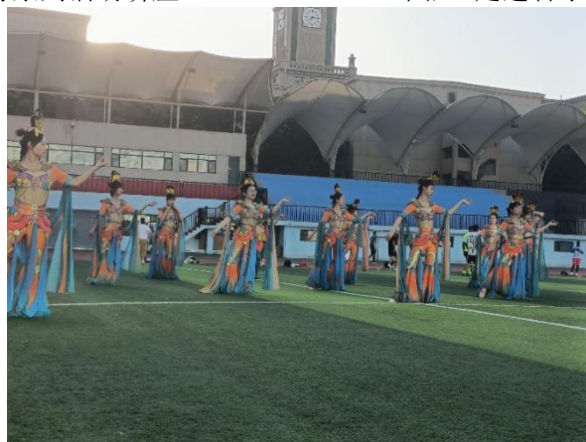
图七 《舞蹈综合艺术》教学成果实践